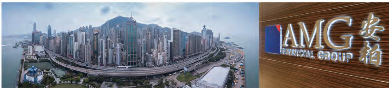
安柏環球金融集團

安柏環球財富管理為安柏環球金融集團之旗艦機構。其發展歷史源於2000年，主要為專業人士及高淨值人士策劃個人化之理財及財富管理方案，並因應不同的目標及需要，於眾多國際著名金融機構中，以豐富的專業知識及客觀態度，為客戶挑選最合適及最具效益的理財產品，以協助他們達致心目中不同的財務目標及理想。