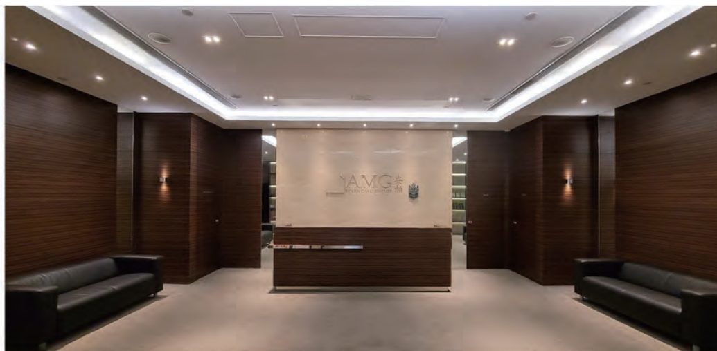
安柏環球金融集團總部

連續十五年 (2005/06至2020/21) 榮獲香港社會服務聯會頒授“商界展關懷大獎”。